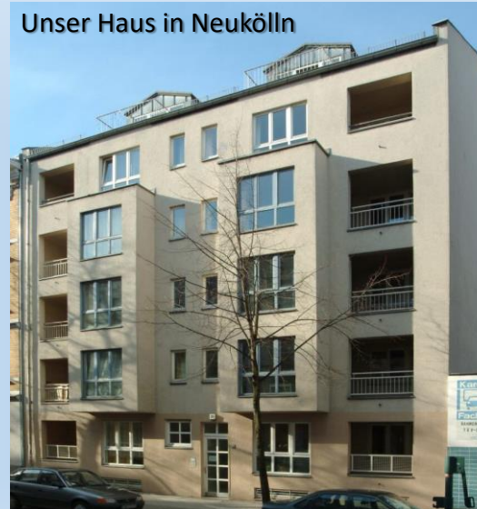
Unser Haus in Neukölln