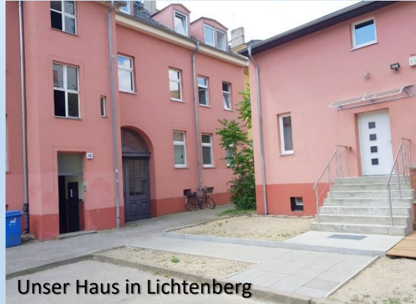
Unser Haus in Lichtenberg